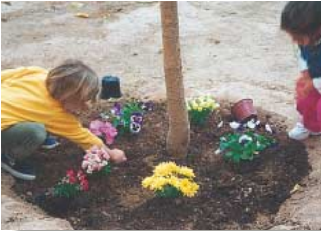
«Φυτεύουμε τον κήπο με λουλούδια.»