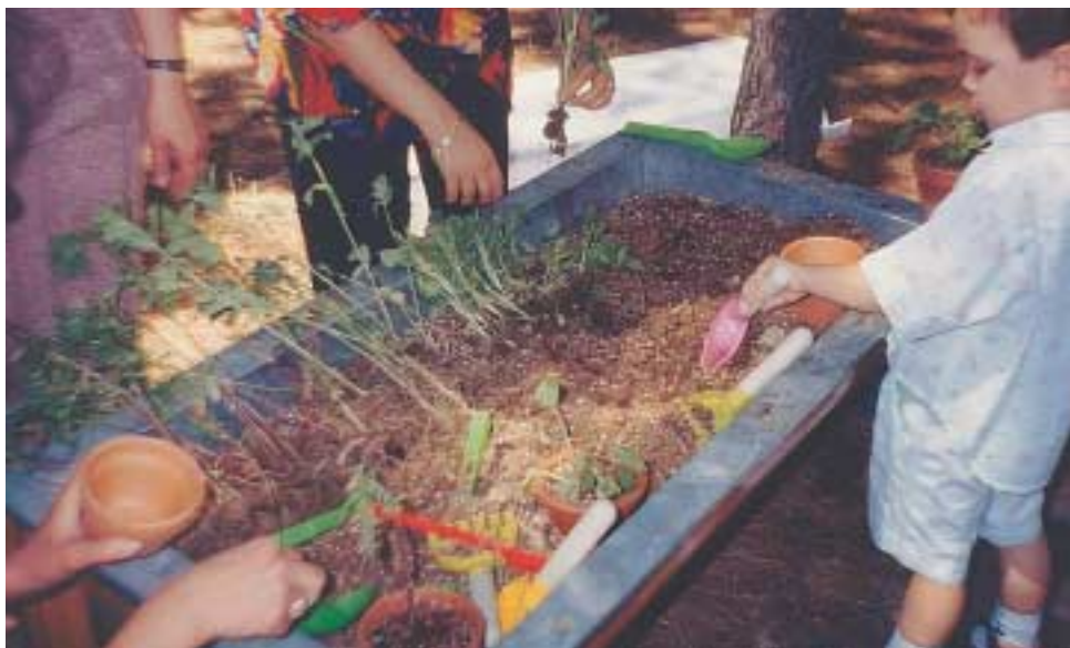
«Το παρτέρι μου χρειάζεται περιποίηση.»