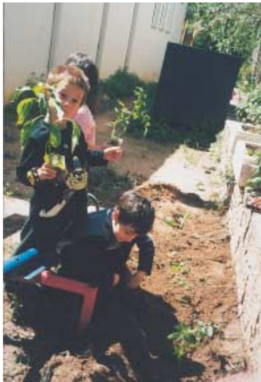
«Ο κήπος μας θέλει φύτεμα για να γίνει πιο ωραίος»

έχει ένα σπόρο σε μέγεθος και σχήμα μικρού αυγού, που βρίσκεται στο εσωτερικό του. Τοποθετούμε το σπόρο σε ένα γυάλινο δοχείο με νερό με το φαρδύ του μέρος προς τα κάτω. Προσέχουμε, ώστε ο σπόρος να μην είναι βυθισμένος, αλλά να αγγίζει απλώς το νερό. Μπορούμε να τον στηρίξουμε στερεώνοντάς τον με οδοντογλυφίδες στο στόμιο του δοχείου. Όταν το φυτό φτάσει σε ύψος 20 εκ. περίπου, κόβουμε τις άκρες των βλαστών του, για να πυκνώσει και να φουντώσει. (Ουίν Μ. και Πόρτσερ Μ., 1981, σελ 147).